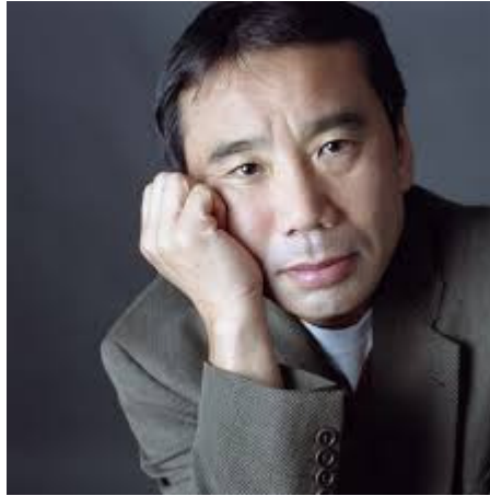
هاروکی موراکامی Haruki Murakami

هاروکی موراکامی (به ژاپنی: 村上春樹) (زاده ۱۲ ژانویه ۱۹۴۹) نویسنده برجسته ژاپنی و خالق رمان کافکا در ساحل و مجموعه داستان بعد از زلزله است. داستان‌های او اغلب نهیلیستی و سوررئالیستی و دارای تم تنهایی و ازخودیگانگی است.